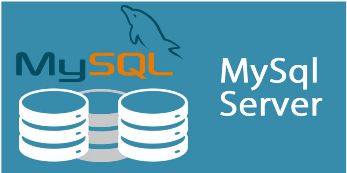
Hình 1.1: MySQL